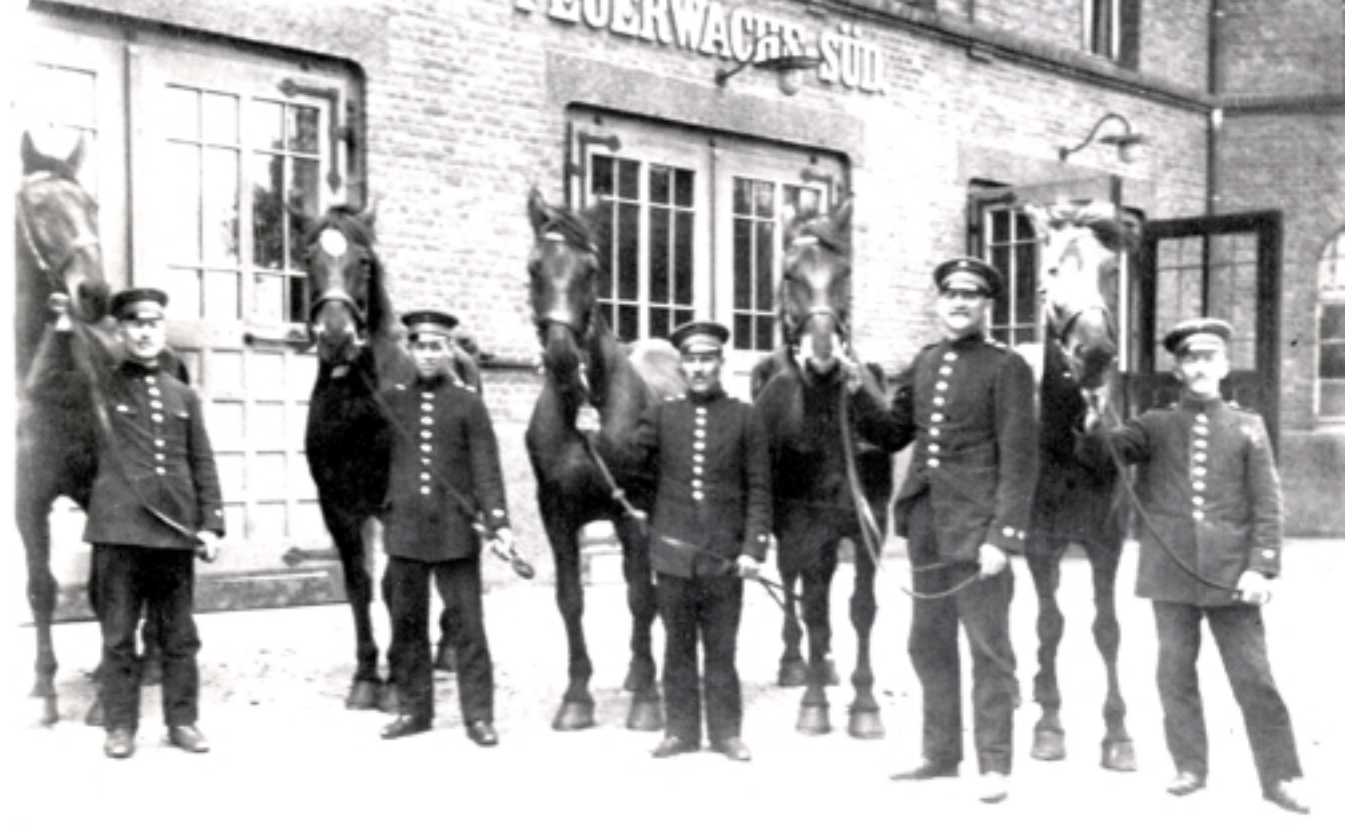
1917-1919, Entwurf für die Südwache in Halle a. M. (Architekturbüro im Reich mit 27 Mitgliedschaften) Die Wache